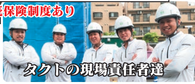
タクトの現場責任者達